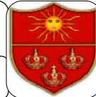
TABLA DE RETENCIÓN DOCUMENTAL