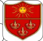
TABLA DE RETENCIÓN DOCUMENTAL