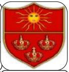
TABLA DE RETENCIÓN DOCUMENTAL

CÓDIGO: GIC-FO-17 VERSIÓN: 01 FECHA: 20/05/2017 TRD: PÁGINA: