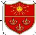
TABLA DE RETENCIÓN DOCUMENTAL